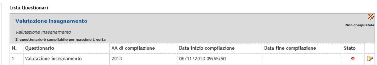
Figura 5 – Questionario la cui compilazione è stata interrotta

Subito dopo la conferma della compilazione potrete stampare il questionario cliccando sull'icona a forma di stampante che si trova sulla destra: