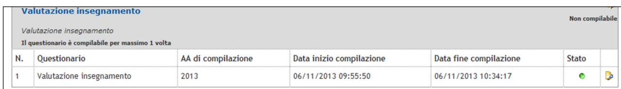
Figura 7 – Questionario compilato e icona con lente di ingrandimento

Se volete effettuare nuovamente la stampa in un momento successivo, cliccate su “Didattica”, poi su “Questionari”, poi sull'icona del questionario (che sarà di colore verde) e infine sull'icona con la lente di ingrandimento che si trova a destra del questionario compilato: