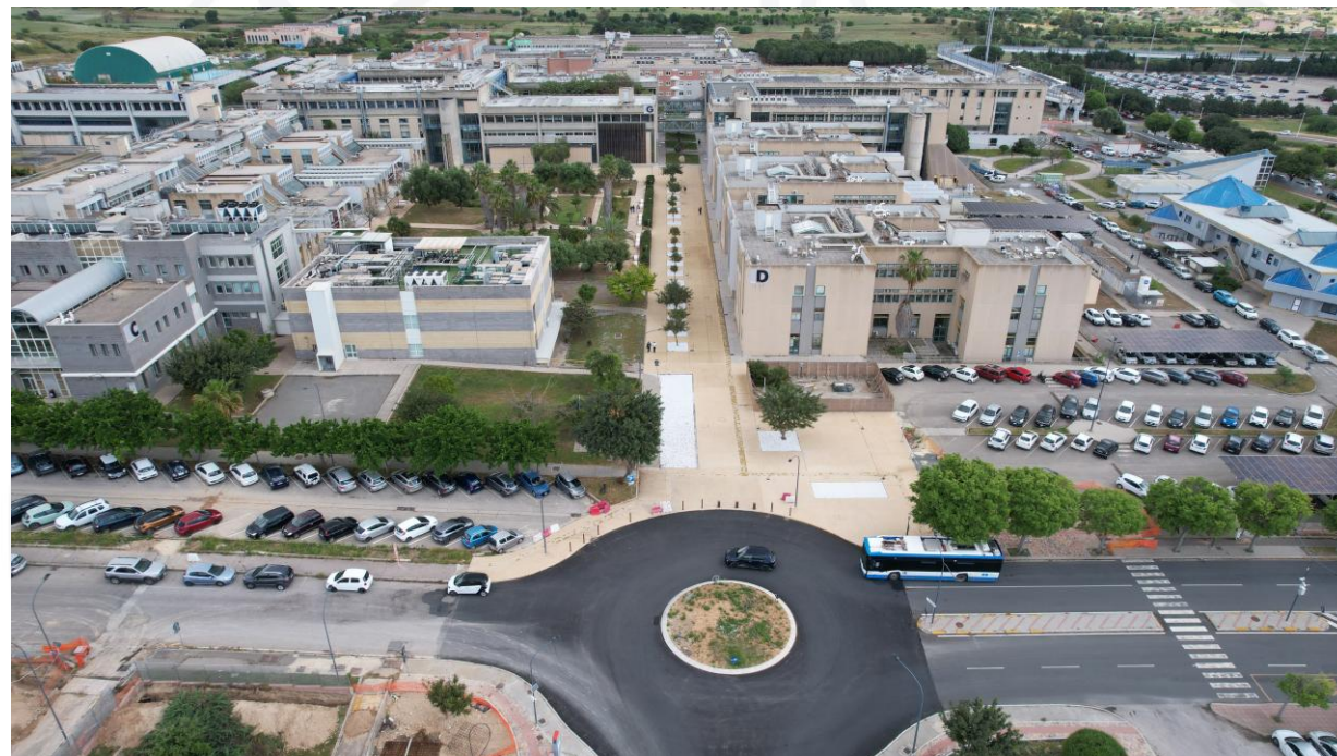
POST: Nuova area pedonale di ingresso al campus